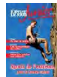
Le numéro de mars 2012