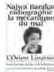
Le numéro de mars 2012