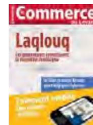
Le numéro de février 2012

La tarification hospitalière en voie d'amendement